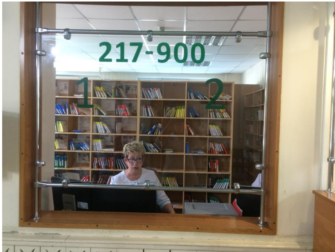
Картотека в регистратуре