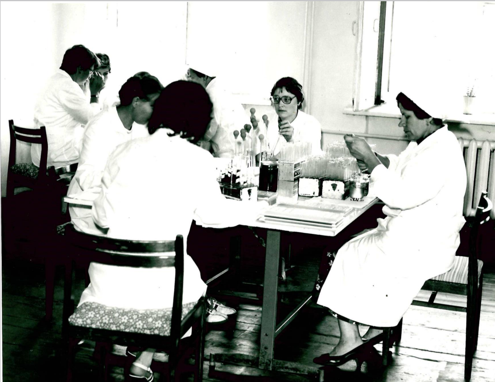
Клинико- диагностическая лаборатория, Проведение исследований. 80-е годы