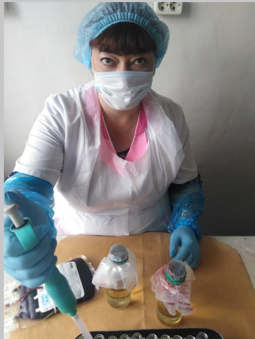
Кабинет первичного скрининга