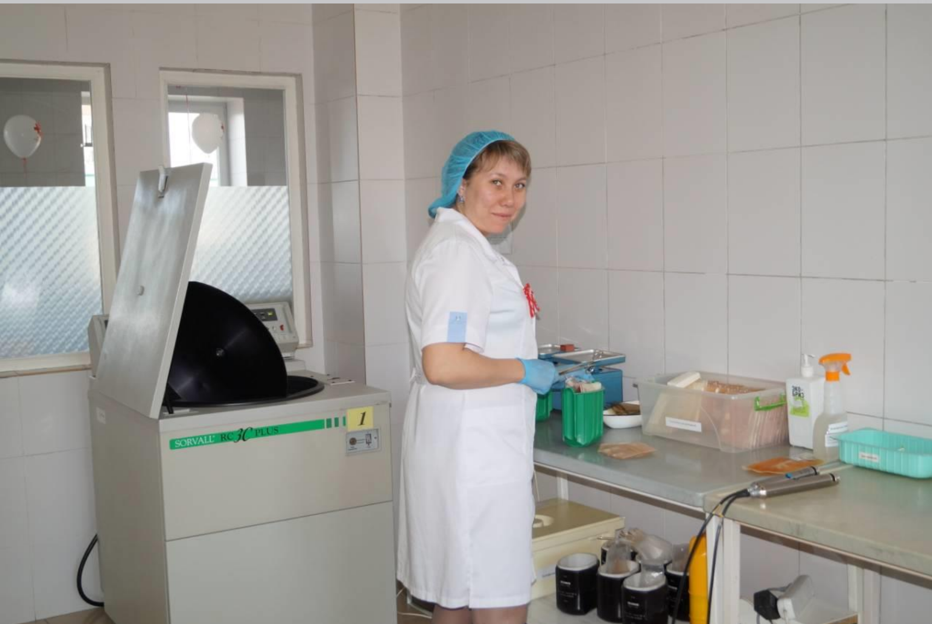
Отдел заготовки крови