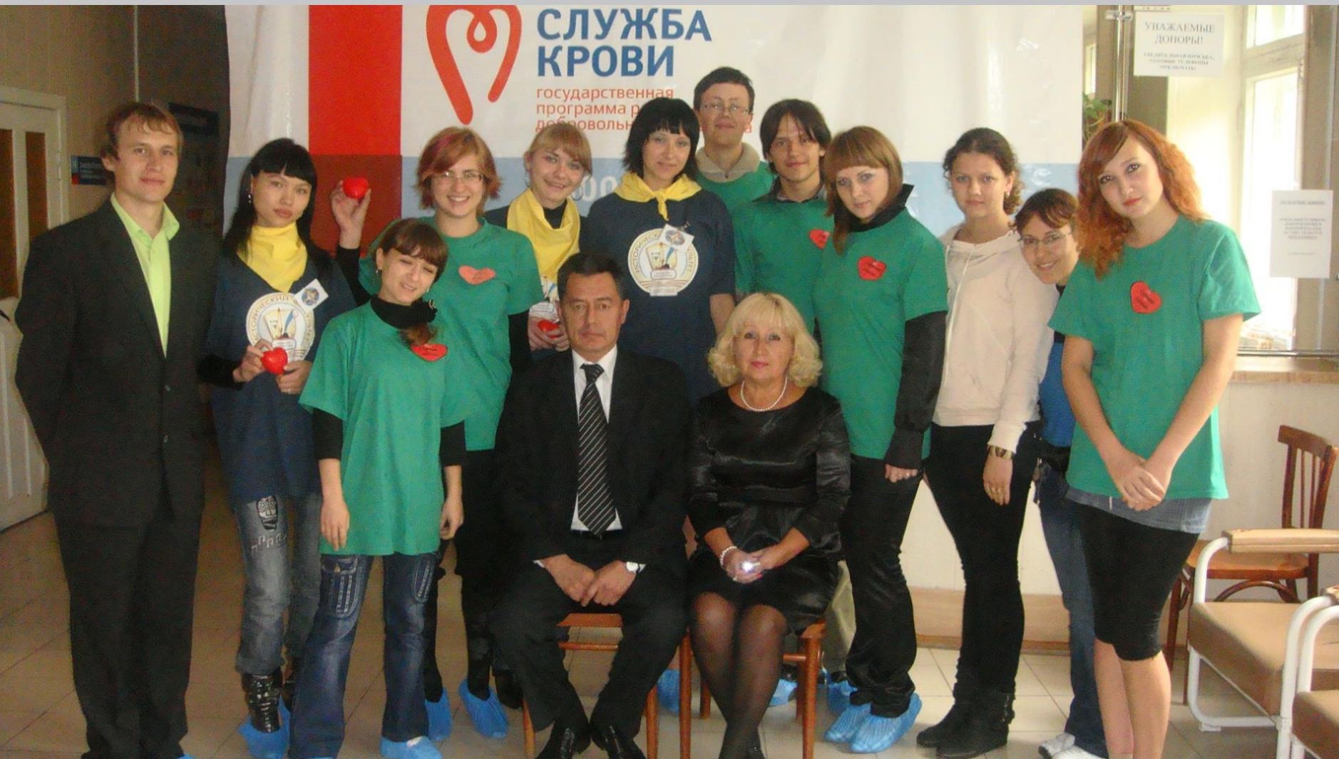
Встреча с волонтерами и представителями прессы 2006 г.