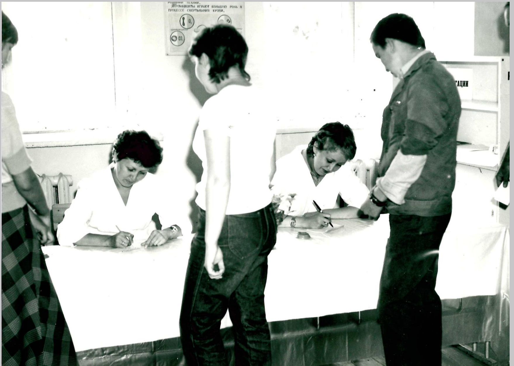
День донора во время проведения учений, 29-30 июля 1985 г.