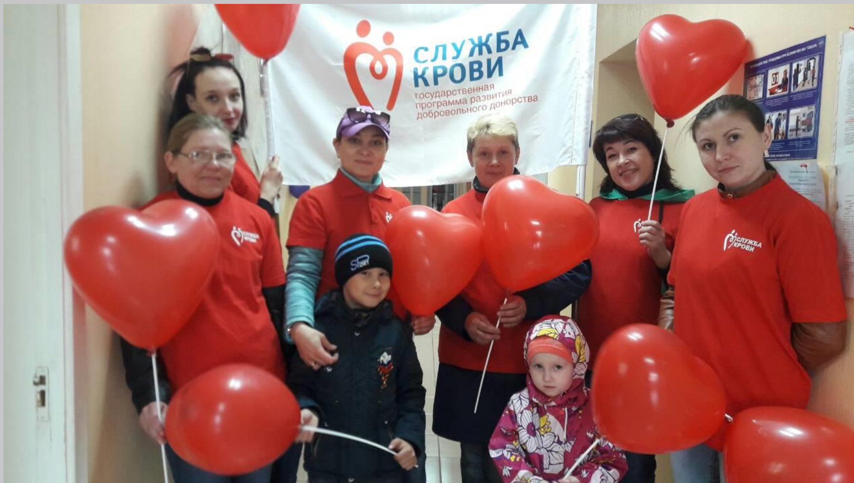
Национальный день донора 20 апреля 2019 г.